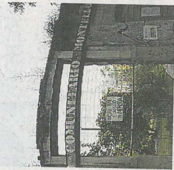
Riqualificazione Lavori al via a Pasqua

Fondazione Cariplo, tramite bando, ha deliberato di assegnare all'associazione «Giardini in transito», che ha in carico la gestione del verde condiviso, 50 mila euro; si aggiungono a questi altri 30 mi-